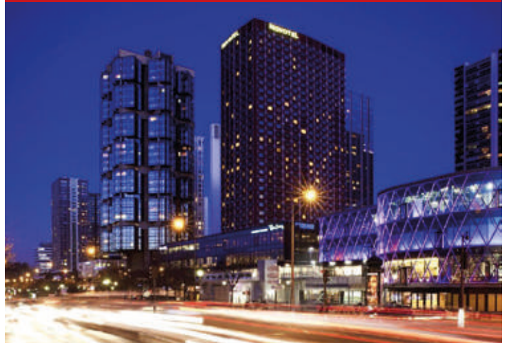
Novotel Paris Centre Tour Eiffel