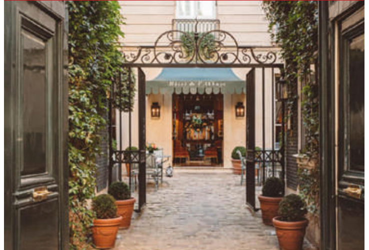
De L'Abbaye Collection