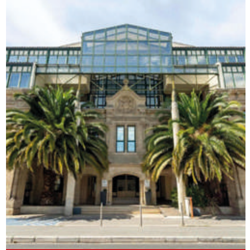
Mercure Chateau Chartron