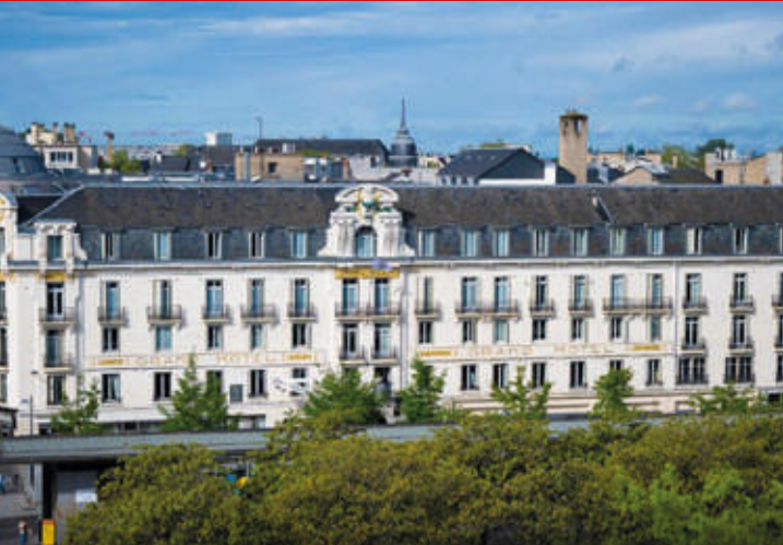
Le Grand Hotel de Tours