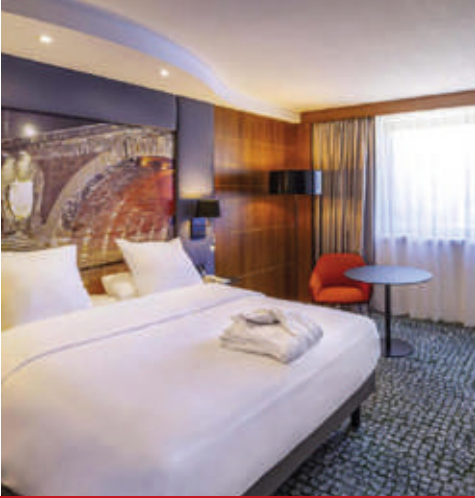
Novotel / Mercure Compans