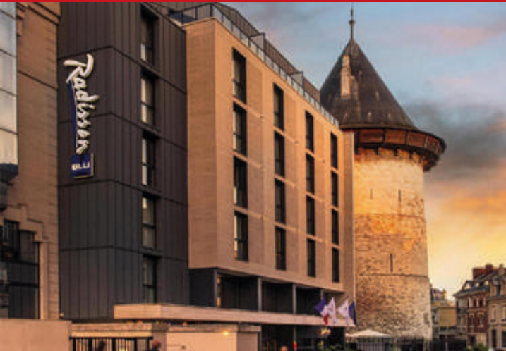
Radisson Blu Rouen Centre